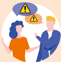
Rodina a přátelé, sousedé